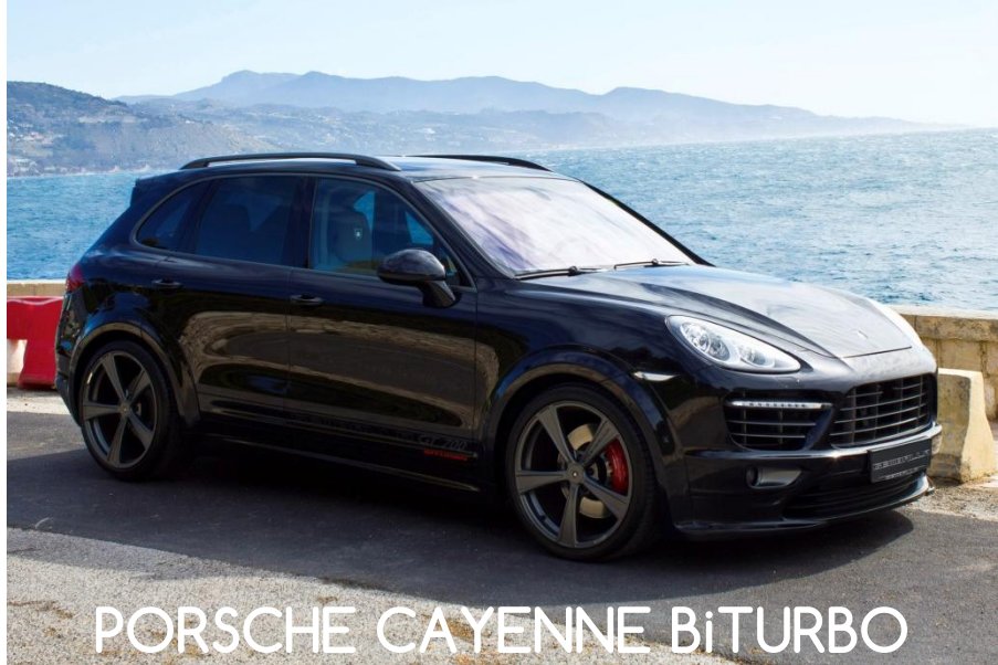
PORSCHE CAYENNE BiTURBO

2005-ös évjáratú Porsche Cayenne BiTurbo gépkocsimat használtan vásároltam. Hibamentes, a gyári értékeket mindig hozó autóról van szó annak ellenére, hogy használt az autó.